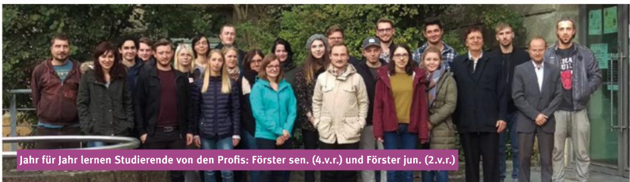
Jahr für Jahr lernen Studierende von den Profis: Förster sen. (4.v.r.) und Förster jun. (2.v.r.)